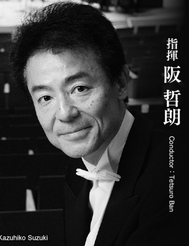
指揮 阪 哲朗

Facebook : yamagatasymphony X(Twitter) : @y_symphony