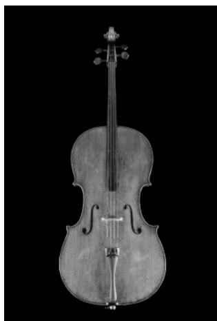
ストラディヴァリウス1696年製チェロ 「ロード・アイレスフォード」